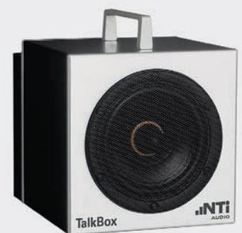
Akustische Referenzschallquelle Acoustic signal generator